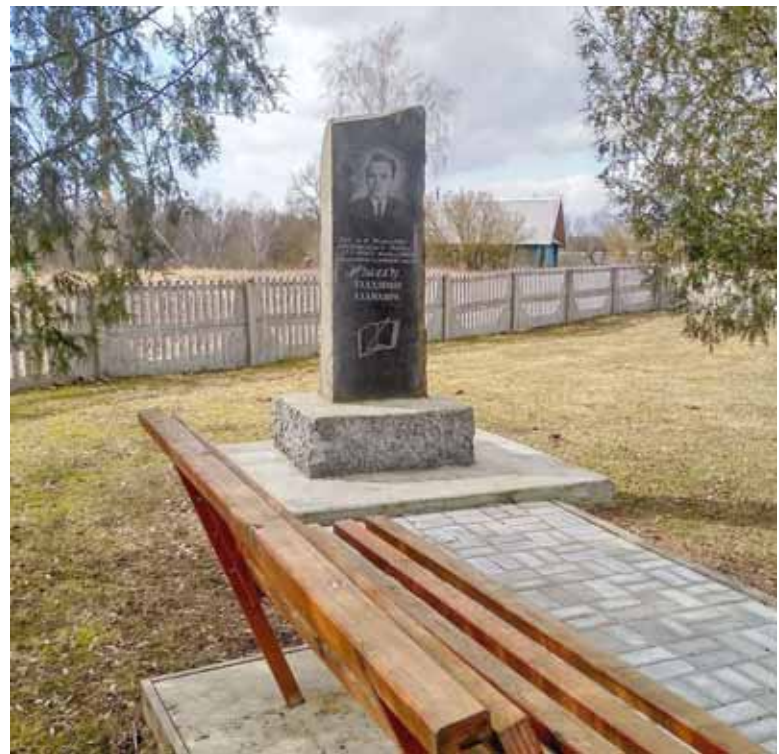
Помнік У. Жылку ў Макашах

Яшчэ адзін пункт юбілейнага плана Жылкі, які выклікаў зацікаўлены водгук бакоў, - каб 2020 год стаў першым годам тра-