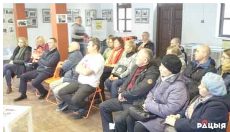
Сустрэча ў Гародні