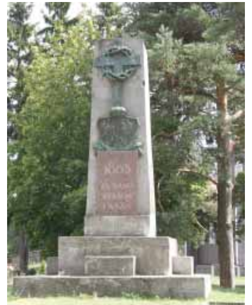
Ф. Рушчыца, Балзукевіч. Помнік паўстанцам 1863 года ў Дубічах, у аснову якога закладзены пастамент віленскага помніка Мураўёву-Вешальніку.

На вясковых могілках пры касцёле ў Дубічах пахавалі Нарбута і яго жаўнераў.