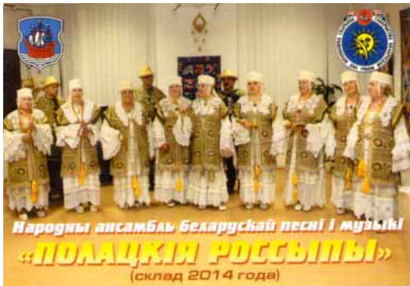
Народны ансамбль беларускай песні і музыкі «ПОЛАЦКІЯ РОССЫПЫ» (склад 2014 года)