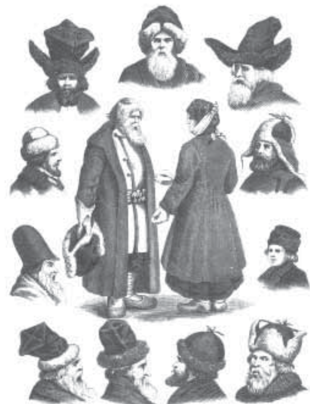
Зімовыя галаўныя ўборы сялян і мяшчан, гравюра XIX ст.

уборам селяніна была шапка-вушанка ("вушанка", "зімка", "аблавуха", "аблавушка"), якую шылі з аўчыны ці футра лісіцы, зайца, вавёркі, ваўка. Да паўсферычнай асновы шапкі-вушанкі прышывалі 4 крылы ("вухі"). Пярэднія і заднія крылы паднімалі і завязвалі зверху на макаўцы, а бакавыя - пад падбародкам. Аблавуха была вельмі цёплай і цяжкай (важыла да чатырох фунтаў). Зверху аблавуху пакрывалі сукном хатняй вытворчасці, а часам (для большай цеплыні) падбівалі пакляй ці лямцам, - і тады яна нагадвала старажытную трохвуголку з адрэзаным ці загнутым пярэднім вуглом. Для замацоўвання на галаве на вушы і шыю спускаліся адвароты, якія задзіралі ўверх ці завязвалі дадаткова шнуркамі.