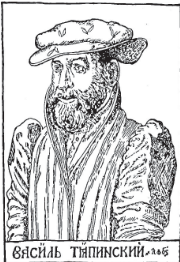
Васіль Цяпінскі ў шапцы часоў Адраджэння. Партрэт пачатку XVI ст.