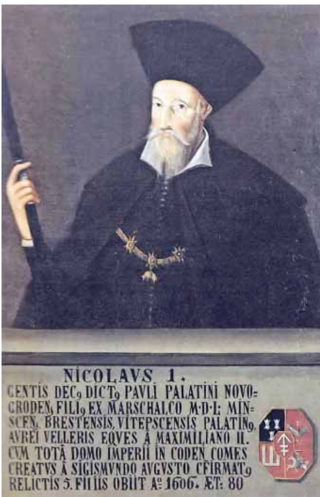
Мікалай Паўлавіч Сапега (каля 1525-1599). Партрэт 1709 г.