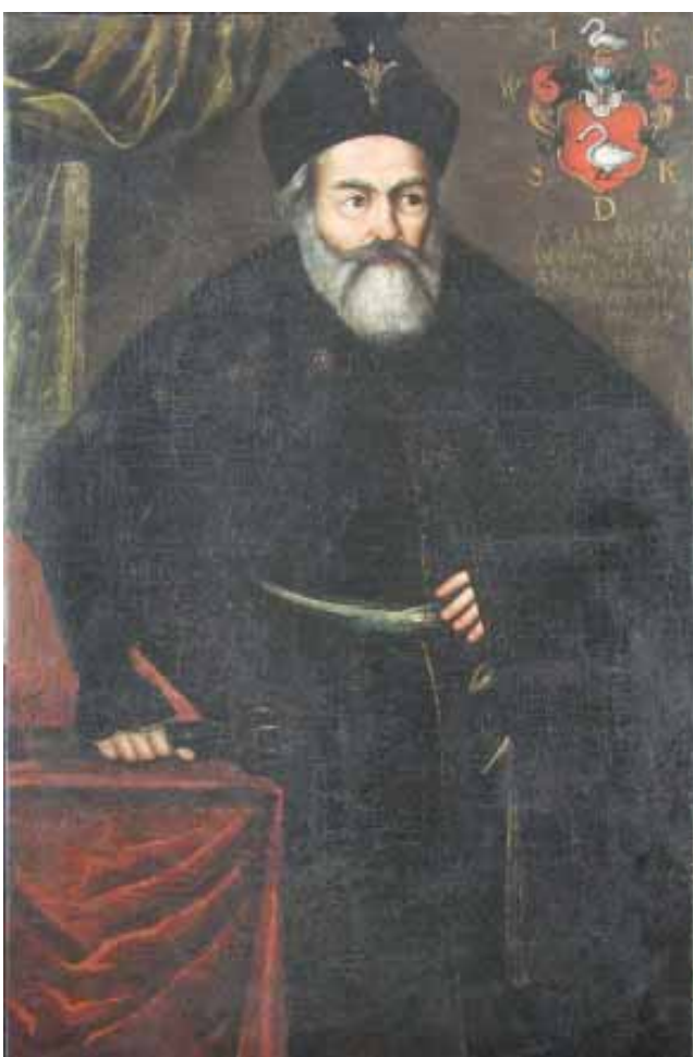
Якуб Тэадор Кунцэвіч. Партрэт 1660-х гг.