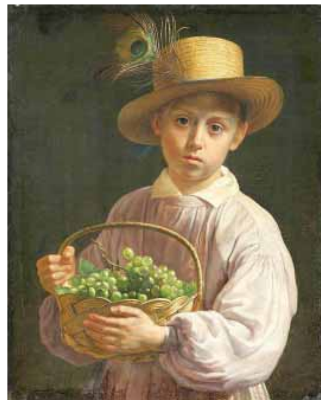
Саламяны капялюш, які насілі як сяляне, так і заможная шляхта на вёсцы. Мастак Іван Хруцкі, 1830-ыя гг.