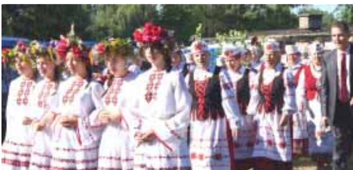
Купалле ў Залуках Беларускага навета

Аўтэнтычнае Купалле ў Вялікім Поўсвіжы, што на Лепельшчыне, зладзілі мясцовыя язычнікі. Каб прыняць удзел у гэтым свяце і ақунуцца ў даўніну, акрамя мясцовых жыхароў, сюды завітала каля сарака беларуска-