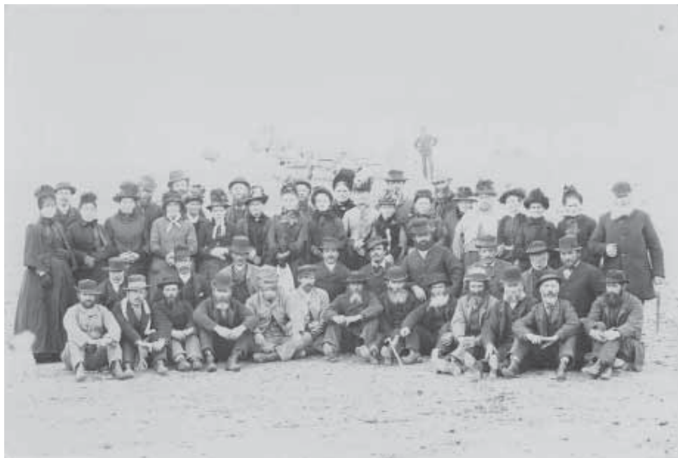
На фота 1890 года - некаторыя з першасяленцаў

Валійская эміграцыя ў Патагонію дзеля захавання ўласнай нацыянальна-культурнай ідэнтычнасці