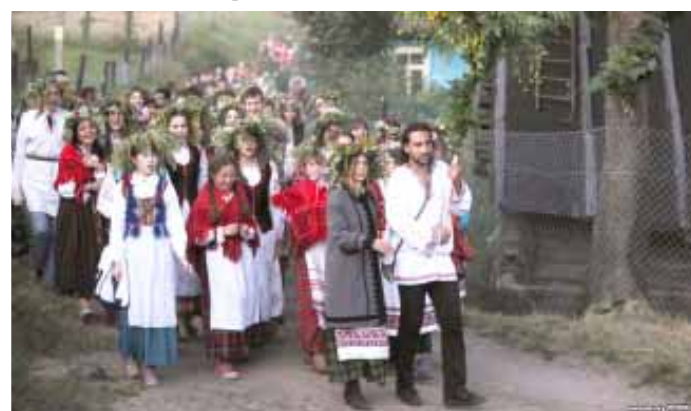
Купалле ў Ракаве

архаічнае свята Купалля, якое нашы продкі святкавалі раней".