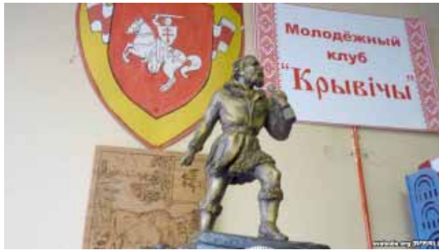
Макет помніка Яну Чэрскаму ў сядзібе моладзевага клуба "Крывічы" (Іркуцк)

За ўдзел у "бунце супраць гасудара-імператара" 18-гадовага Яна, які валодаў бліскучымі здольнасцямі і ведаў 5 моваў, высылаюць у Омск штрафным рэкрутам. І ўжо там, займаючыся самааду-