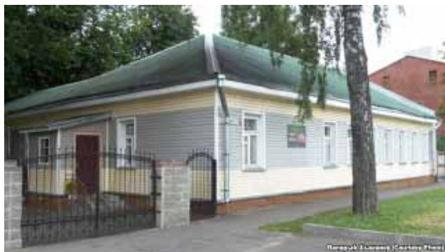
Дом Маўры Чэрскай у Віцебску пасля рамонту ў 2013 г.