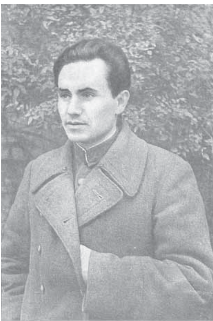
Фёдар Янкоўскі. 1944

Дэбютаваў у рэспубліканскім друку нарысам у 1936 годзе (часопіс "Работніца і калгасніца Беларусі"). Аўтар кніг "Дыялектны слоўнік" (вып. 1-3, 1959-1970), "Беларускае літаратурнае вымаўленне" (1960), "Пытанні культуры мовы" (1961), "Вусная мова і выразнае чытанне" (з У. Калеснікам, 1962), "Роднае слова" (1967, 2-е выданне ў 1972, 3-е пад назвай "Беларуская мова" ў 1978), "Беларуская фразеалогія" (1968,