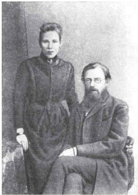
Маўра і Ян Чэрскія, 1891 г.