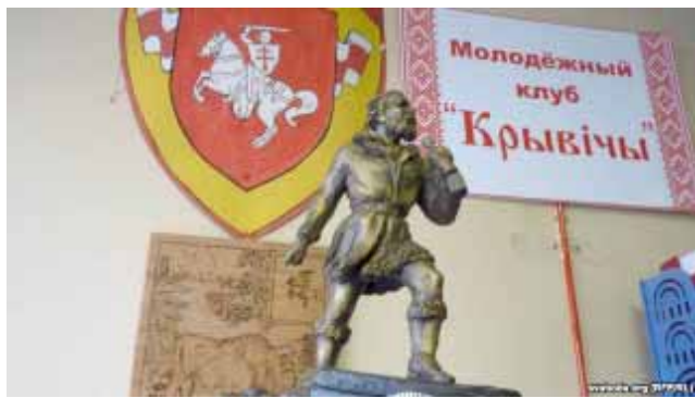
Макет помніка Яну Чэрскаму ў сядзібе моладзевага клуба "Крывічы" (Іркуцк)

За ўдзел у "бунце супраць гасудара-імператара" 18-гадовага Яна, які валодаў бліскучымі здольнасцямі і ведаў 5 моваў, высылаюць у Омск штрафным рэкрутам. І ўжо там, займаючыся самаду-