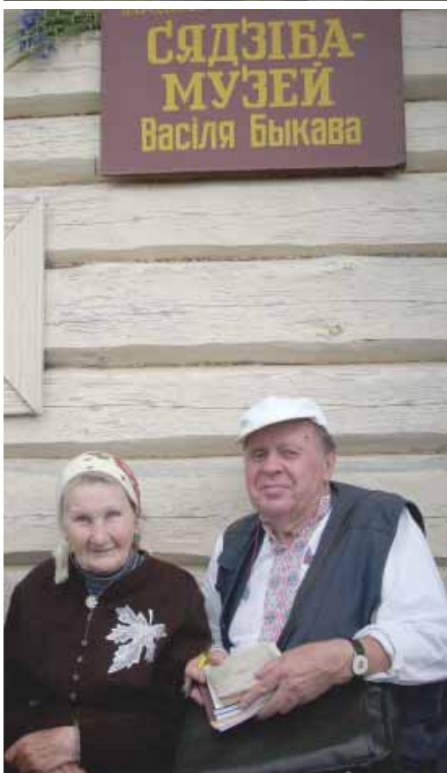
рэслена." ("Бласлаўленыя Кушляны")