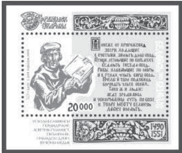
сілі 16 красавіка ў дзень адкрыцця XI Міжнародных кнігазнаўчых чытанняў. Радзё Свабода.