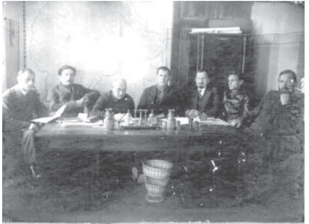
Педтэхнікум у Ішыме, 1934 г.

Любілі мы перапынкі ў часе татавай работы. Меў ён добры голас і слых. Котцы нашай гэты талент дастаўся ў наследства ад бацькі. Вось у часе адпачынку клікаў ён усіх нас на канапу і мы на 2 ці на 3 голаса спявалі прыгожыя бе-