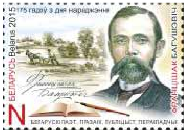
Марка да 175-х угодкаў Ф. Багушэвіча