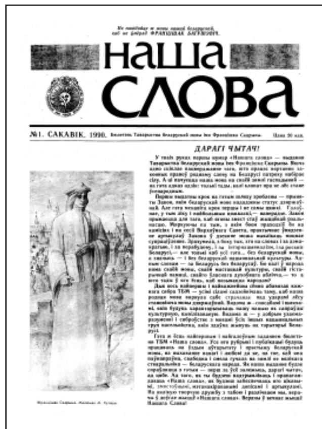
Першы нумар “Нашага слова” за сакавік 1990 г.

яго рубрыкі і публікацыі будуць працаваць на ўздым аўтарызту і прэстыжу беларускай мовы, на выхаванне павагі і любові да яе, на тое, каб яна паўнапраўна, свабодна і смела гучала на зямлі яе вялікага стваральніка - беларускага народа. Як наша выданне будзе спраўляцца з гэтым - перш за ўсё залежыць, дарагі чытач, ад цябе. Ад таго, як ты будзеш падтрымліваць і прапагандаваць “Наша слова”, як будзеш забяспечваць яго цікавымі, змястоўнымі, мэтанакіраванымі допісамі і артыкуламі. На вялікую творчую дружбу з табою і разлічваем мы, верачы ў доўгае жыццё “Нашага слова”. Верачы ў вечнае жыццё нашага Слова!