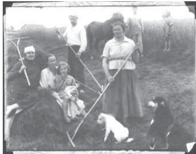
1920-я. Каця п. Свіслач