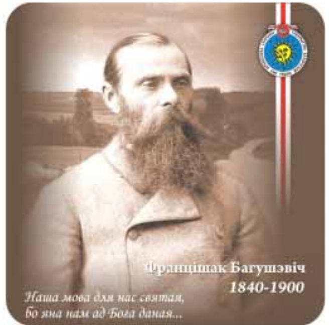
Францішак Багушэвіч 1840-1900 Наша мова для нас святая, бо яна нам ад Бога даная...