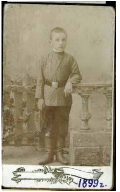
Аркадзь Смоліч. 1899 г.

У 1916 г., калі менскія школы не працавалі з-за эвакуацыі, я паехала ў Маскву вучыцца ў народным універсітэце імя Шаняўскага на нат.пед. аддз. У 1917 годзе вярнулася ў Менск, выйшла замуж і пра-